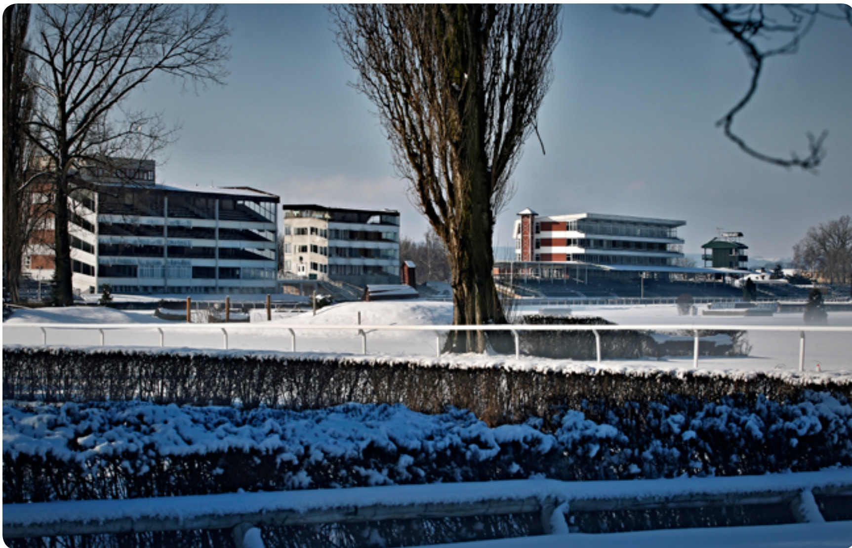
Dostihové závodiště Pardubice / 19. století