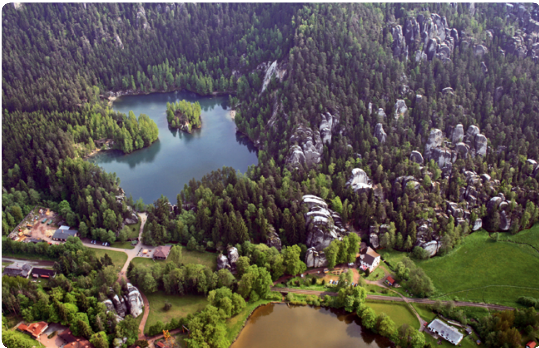
Adršpašsko-teplické skály / skalní města