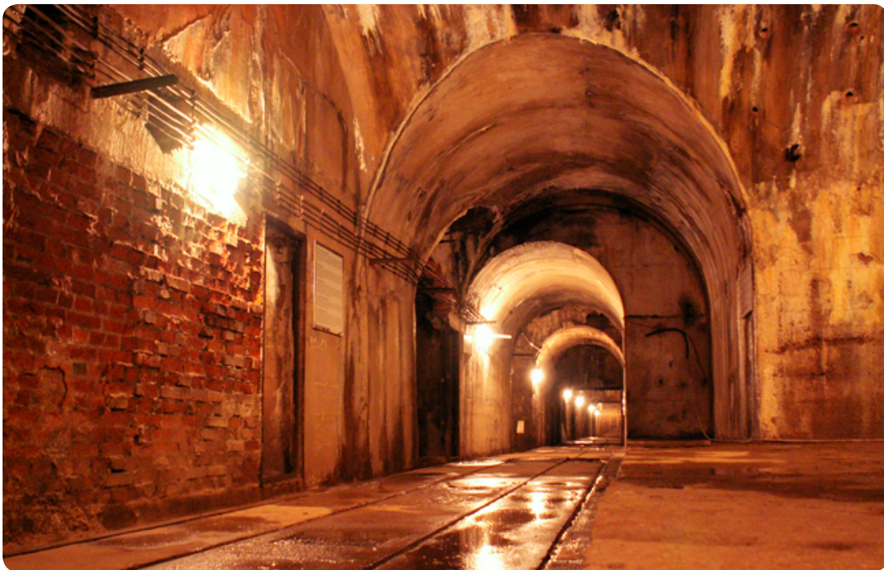
Dělostřelecká tvrz Bouda / vojenský objekt / 20. století