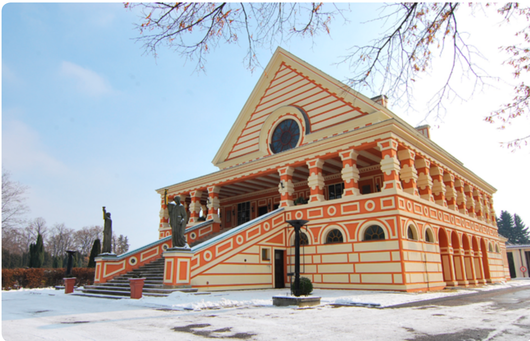
Krematorium Pardubice / rondokubismus / 20. století