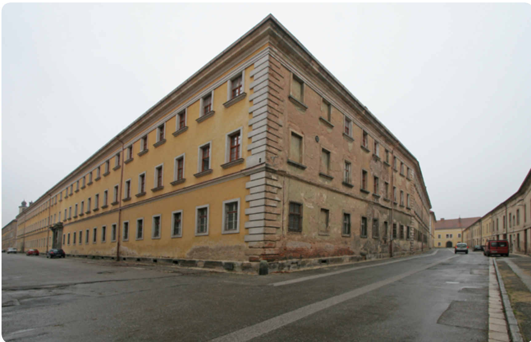
Dělostřelecká kasárna, Josefov / pevnostní město / 18. století