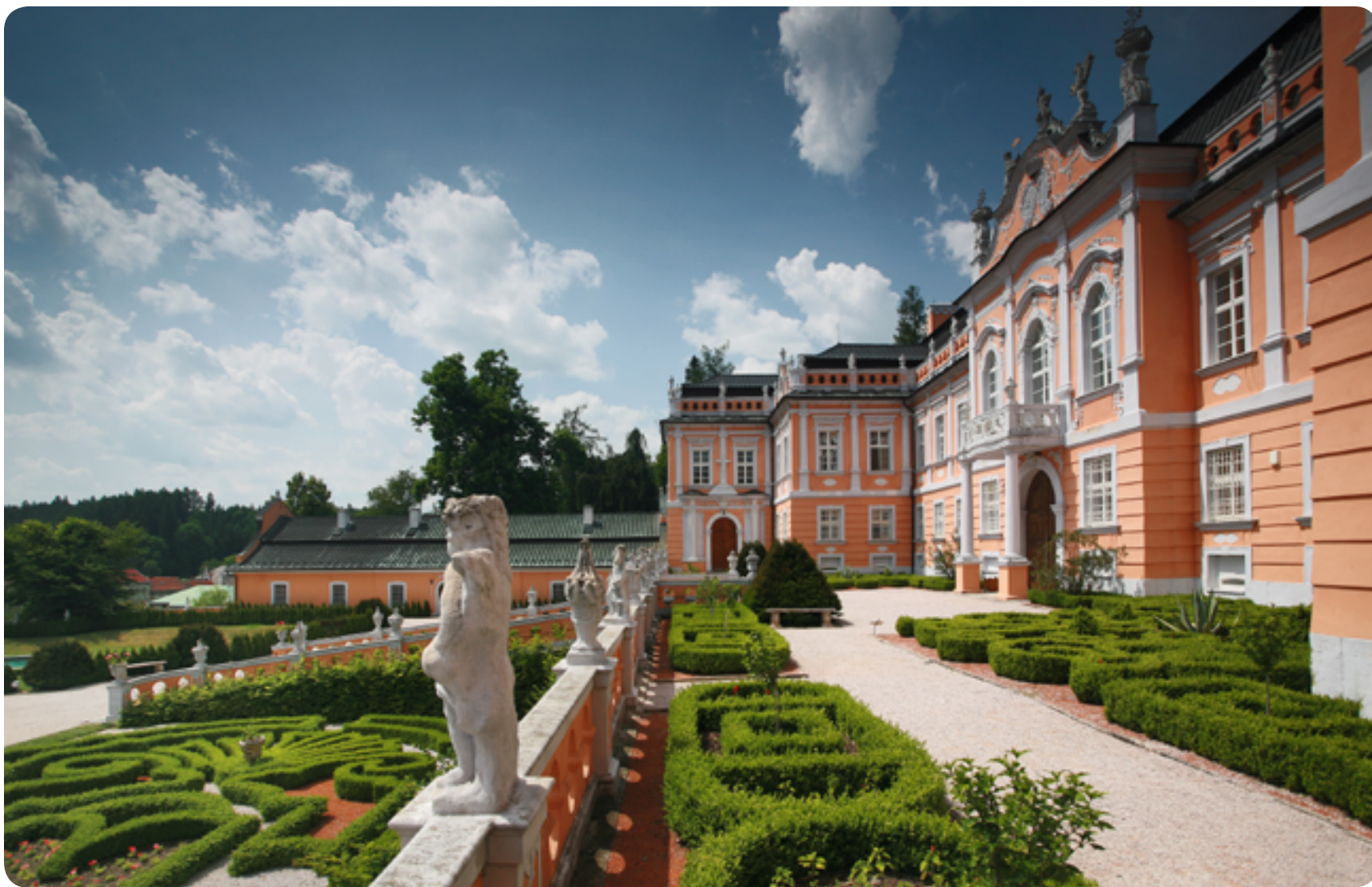
Zámek Nové Hrady / rokoko / 18. století