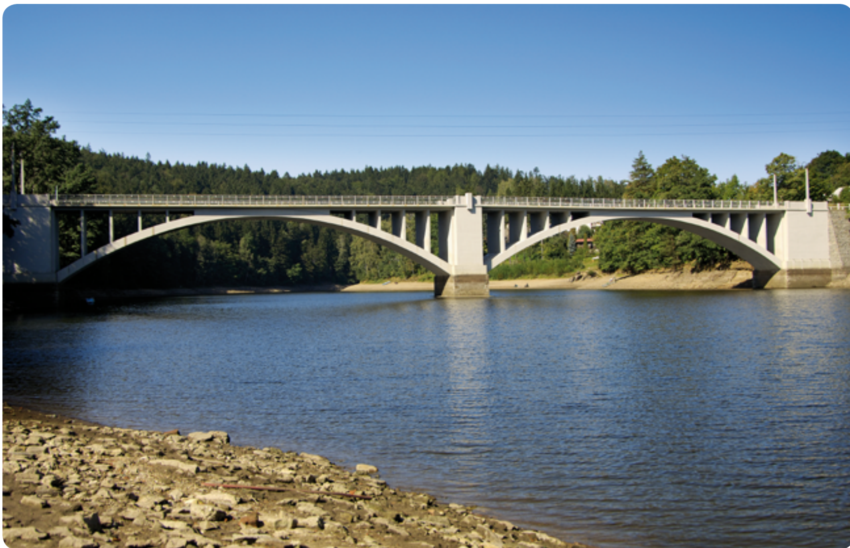
Přehradní nádrž Pastviny / 20. století