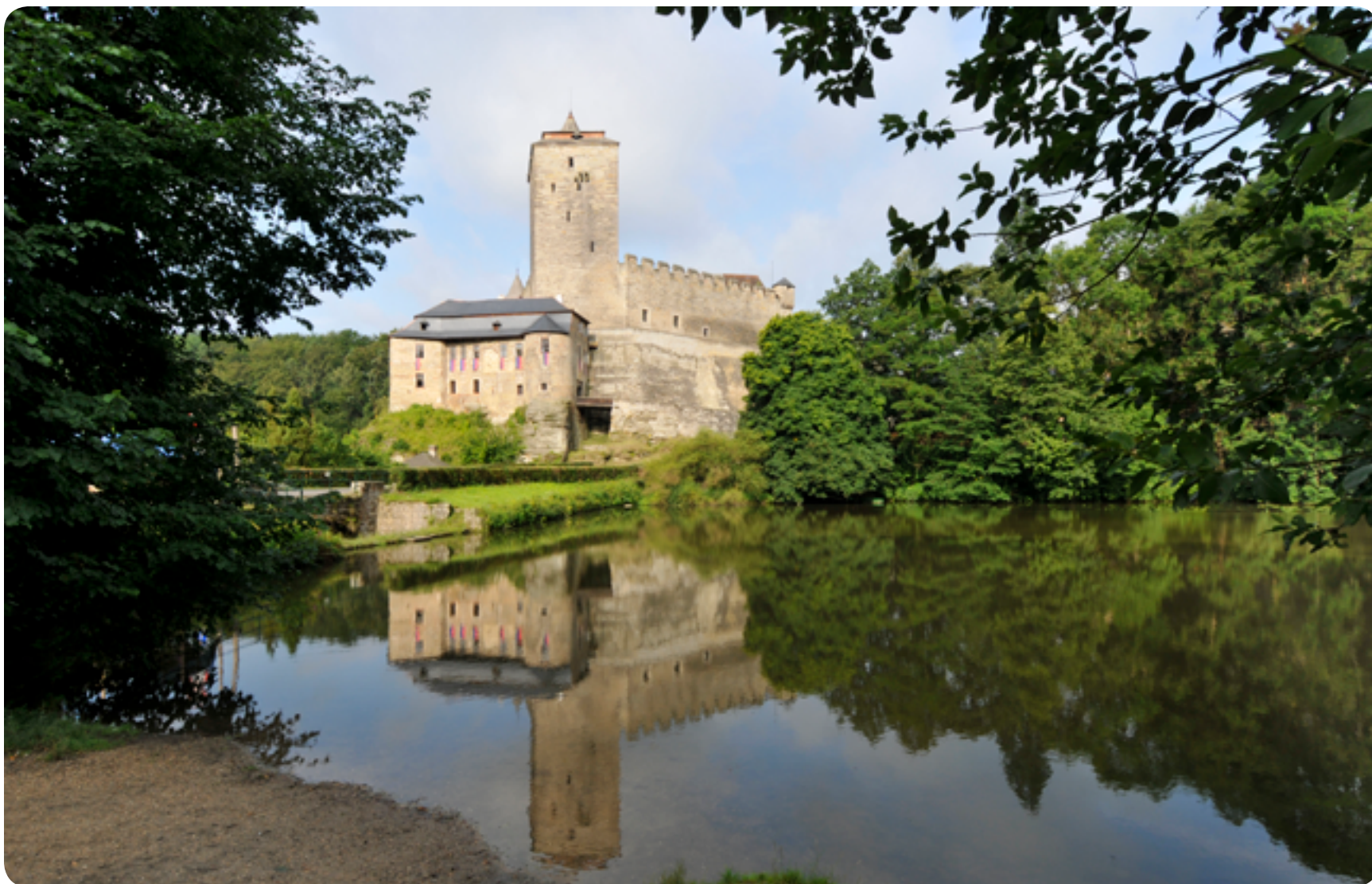
Hrad Kost / gotika / 15. století