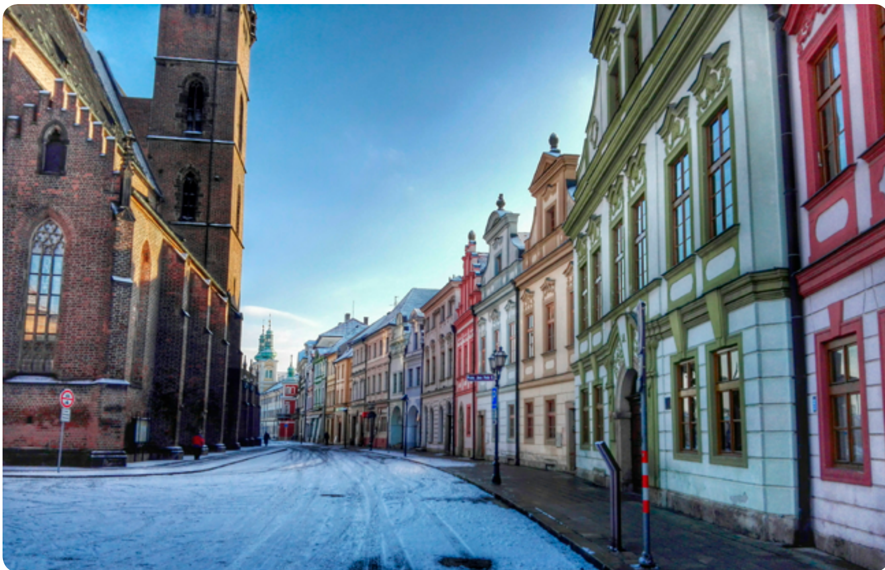
Kanovnícké domy v Hradci Králové / baroko / 18. století