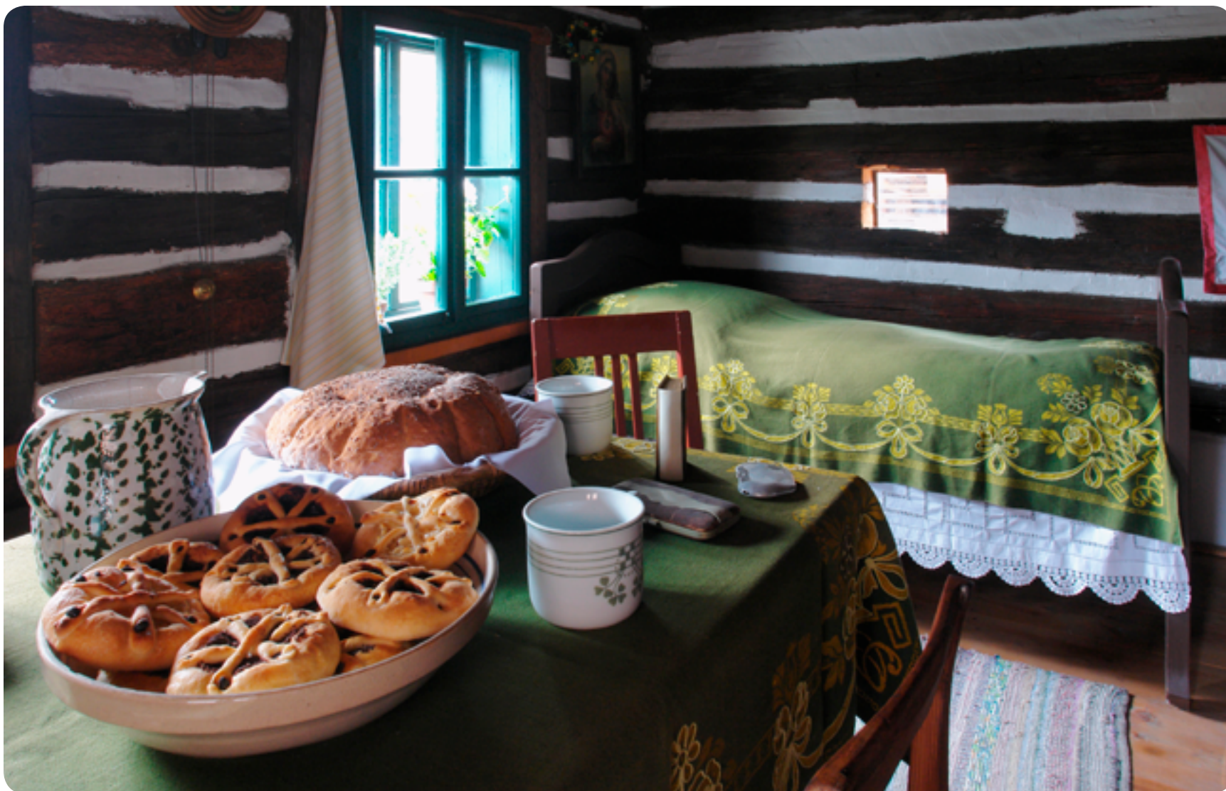
Soubor lidových staveb Vysočina / lidová architektura / 19. století