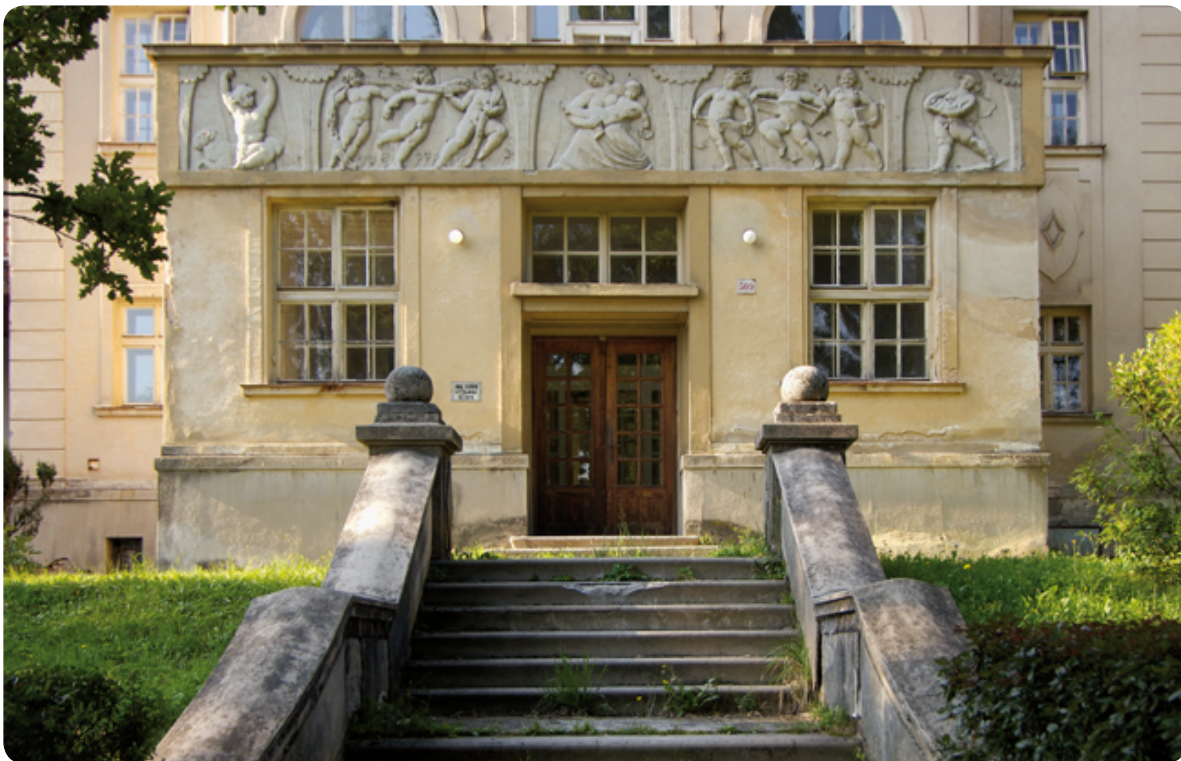
Zemská plicní léčebna Jevíčko / secese / 20. století