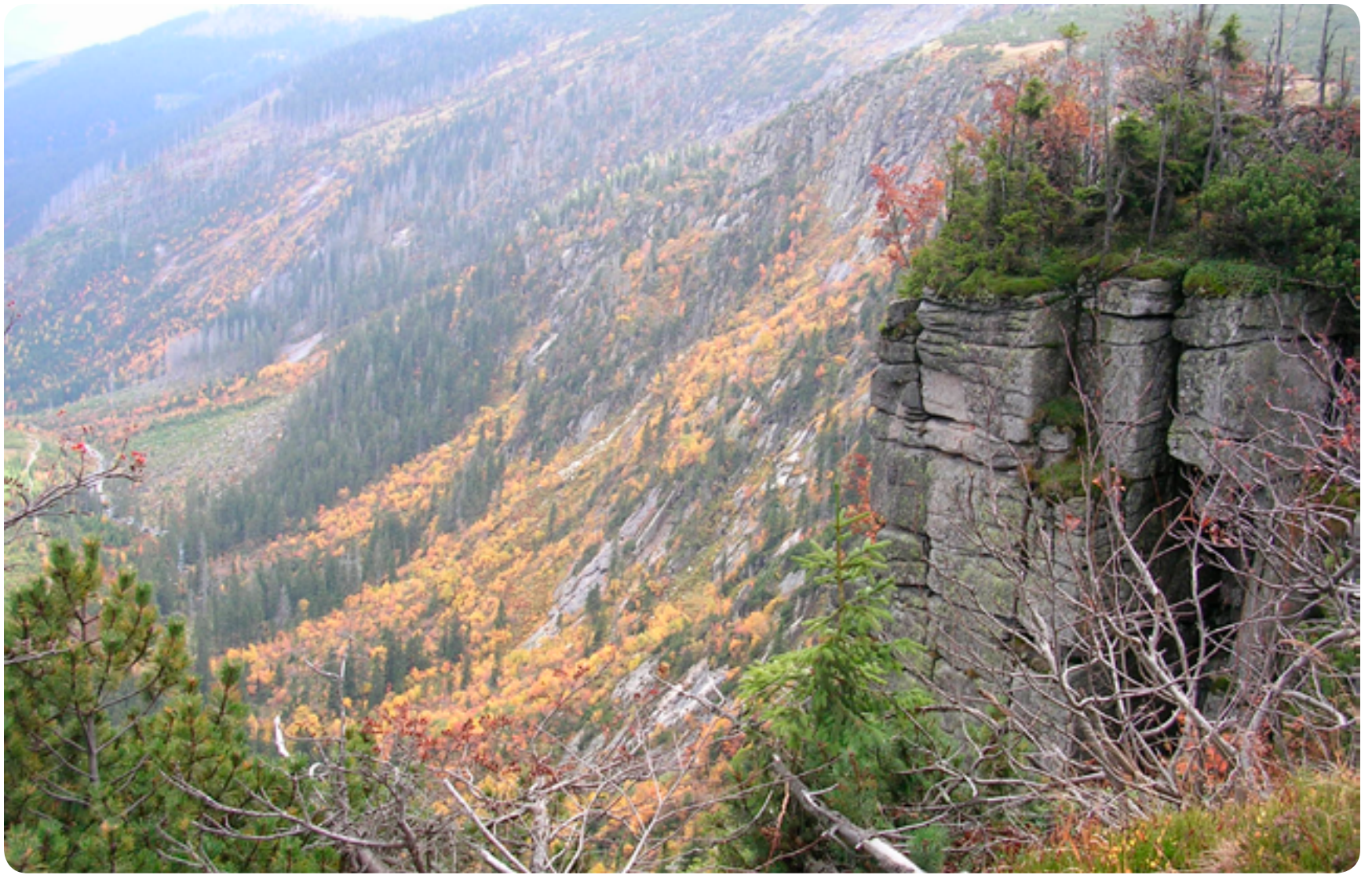
Krkonoše / pohoří