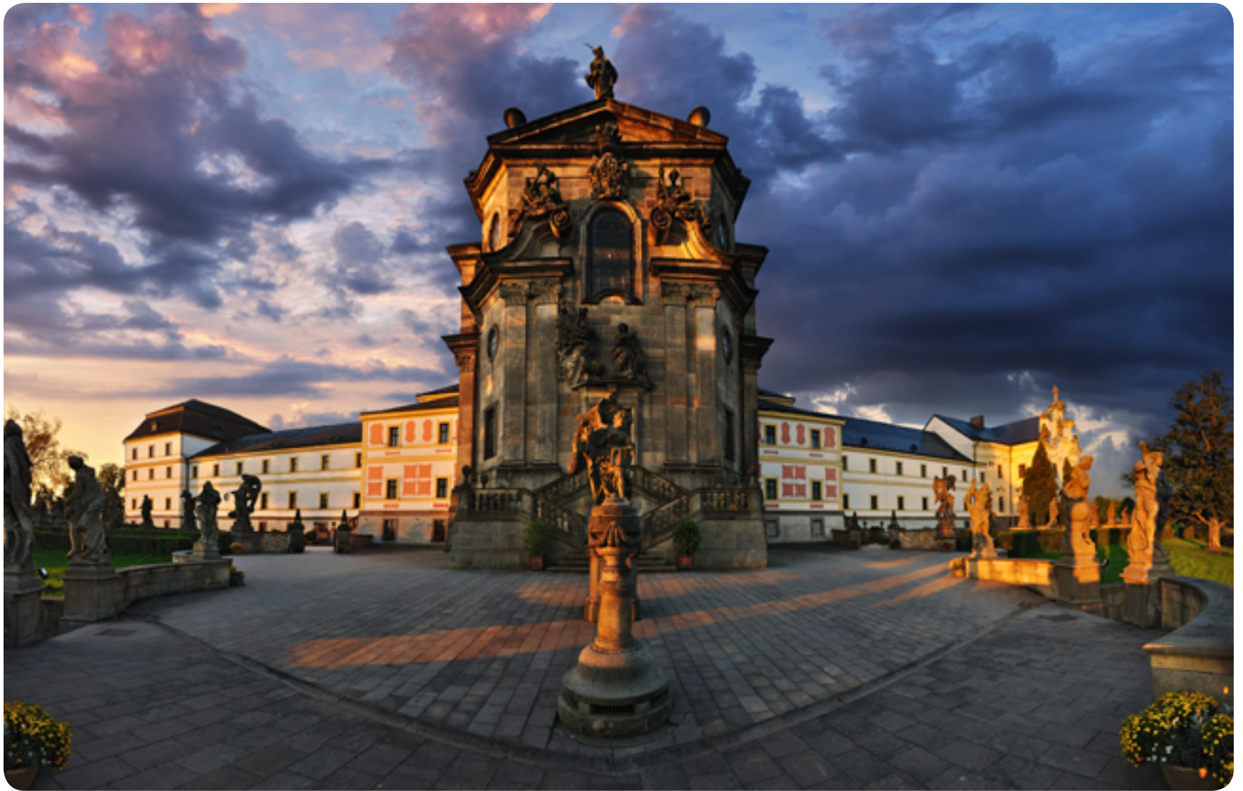
Hospital Kuks / baroko / 18. století